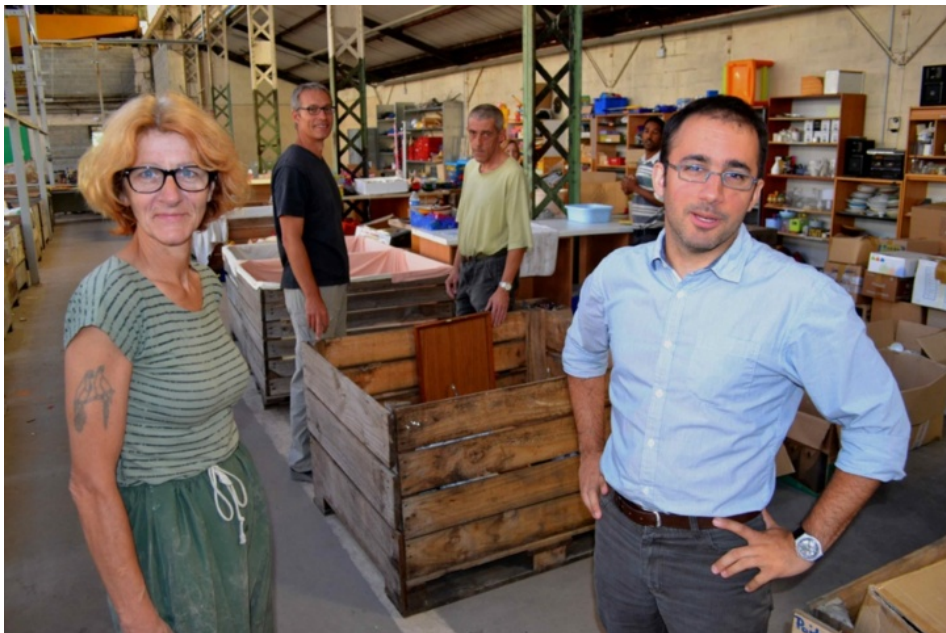
Les Ponts-de-Cé. mercredi 14 août. La quinzaine de salariés de la ressourcerie des Biscottes s'affaire pour être prêt